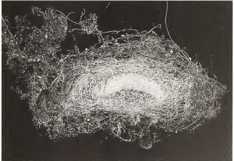
Abb. 3: Puppe von P. rufipes in selbstgesponnenem Kokon im Schlupfwinkel der Wirtsspinne im Freiland (Essen-Kettwig, 1.12.2009). Reste der aufgezehrten Brückenspinne sind links erkennbar

Fig. 2: Bridge spider with wasp larva shortly before the end of the larval development (in the terrarium)